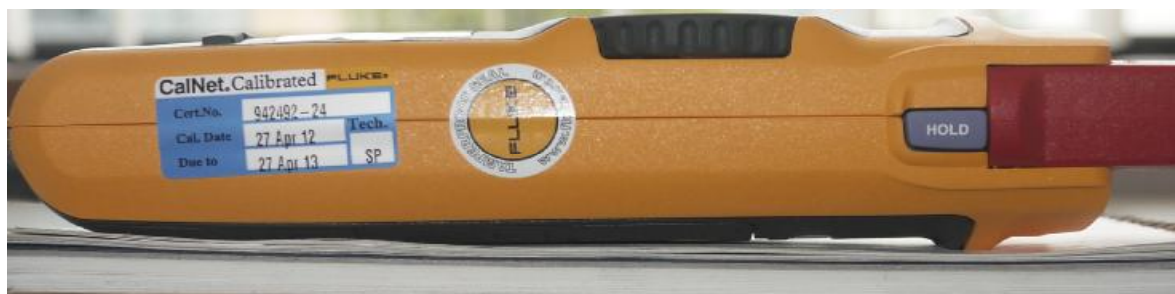
Рисунок 2 - Место пломбирования от несанкционированного доступа

Схема пломбирования клещей от несанкционированного доступа показана на рисунке 2.